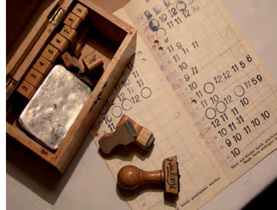
Abbildung oben: bis zur Einführung von Scheibenzuganlagen im Jahre 1966 waren Stempelkarten zur Erfassung der Ergebnisse notwendig