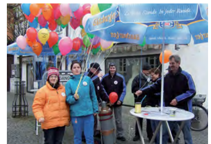
Abb. oben: Aktionstag in Günzburg gegen radikale Gruppierungen - Stand der »Kaiserlich Königlich priv. Schützengesellschaft« und dem Gau Günzburg.