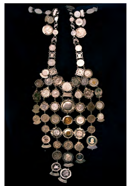
Abbildung unten: Königskette Luftgewehr

Abbildung oben: Ehrengabe zur 500-Jahrfeier der Königlich privilegierten Schützengesellschaft Günzburg im Jahre 1952.