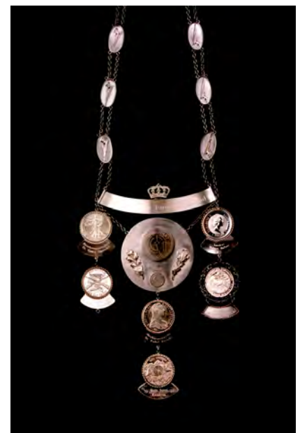
Abbildung rechts: Pistolenkette - angeschafft 1997