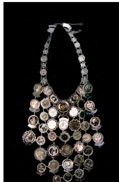
Abbildung unten: Gau-Jugendkette von 1967